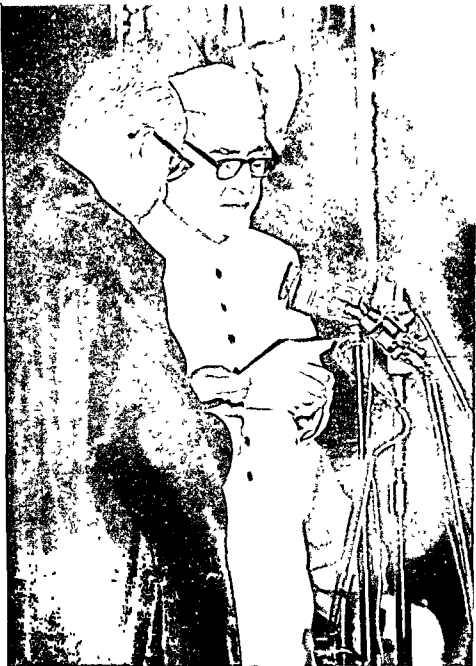
4. : भारत के मुख्य न्यायाधीश, न्यायमूर्ति के. एन. वायू के समक्ष भारत के राष्ट्रपति पद की शपथ लेते हुए डा. जाकिर हुसैन